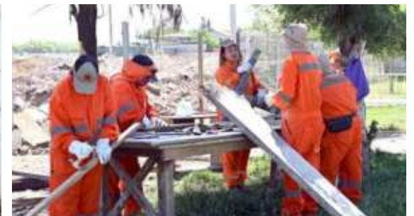
Trabajo en campamentos de habitabilidad y des-habilitación, región Metropolitana y región de Coquimbo