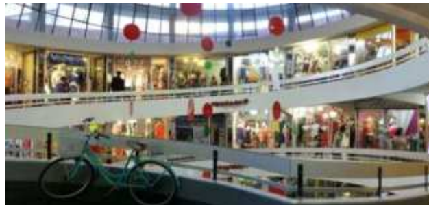
8. Especial Santiago posmoderno Los Caracoles, Providencia