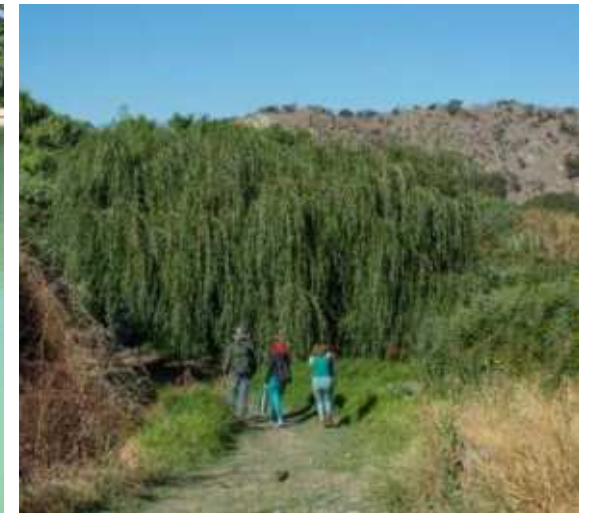
Biorutas Mapocho; Pudahuel, Maipú, Padre Hurtado, Peñaflo, Talagante, El Monte y Isla Maipo