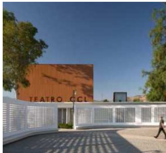
Centro Cultural de Lampa, Lampa