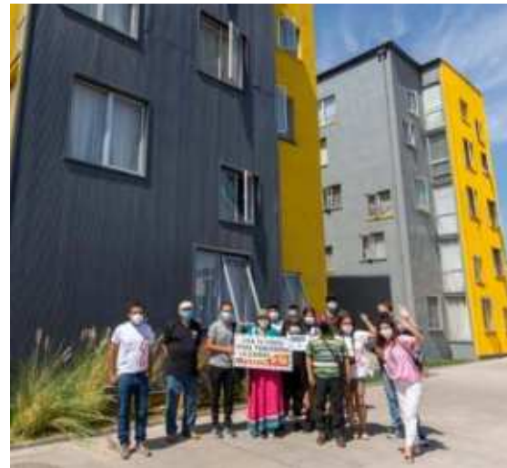
Conjunto Habitacional Justicia Social 1, Recoleta