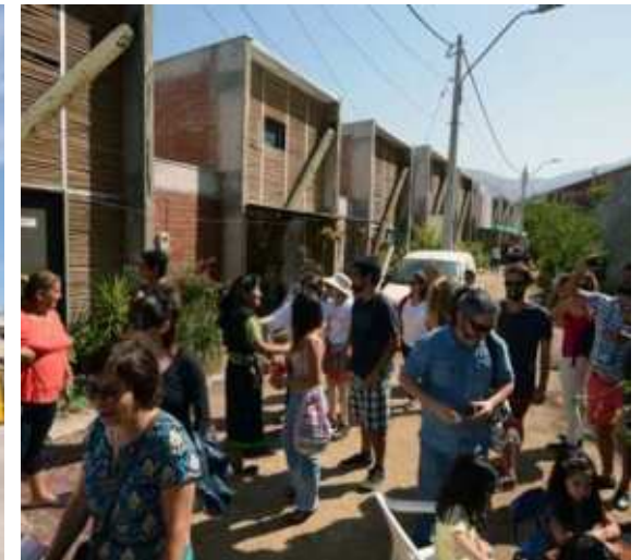
Condominio Vista Hermosa y Viviendas Ruca, Huechuraba