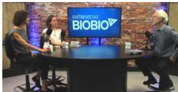
Entrevistas en Radio