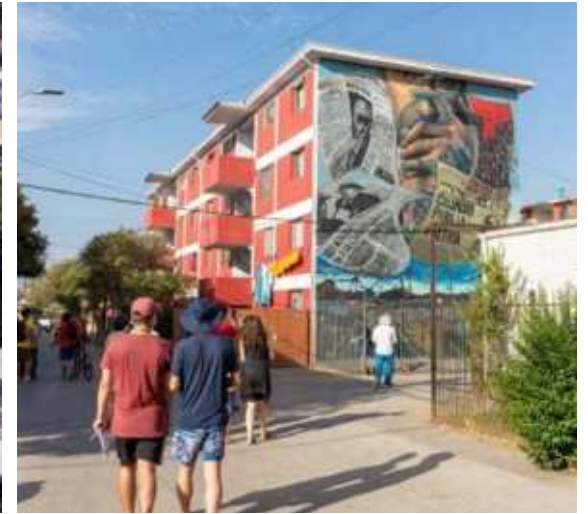
Museo a Cielo Abierto - Mixart, San Miguel