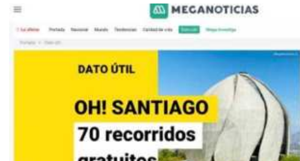
Notas en sitios web