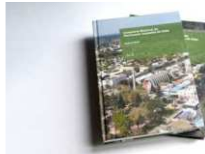
Actualización del Inventario de Patrimonio Cultural Inmueble de la región de Ñuble