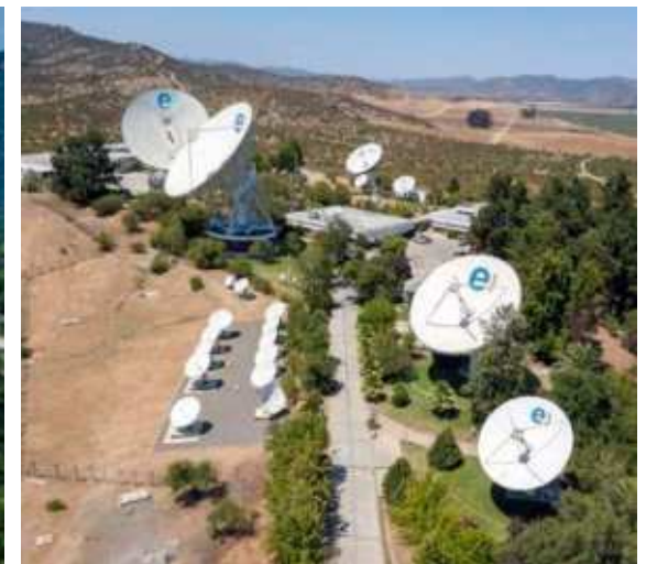
Estación Satelital Longovilo, San Pedro