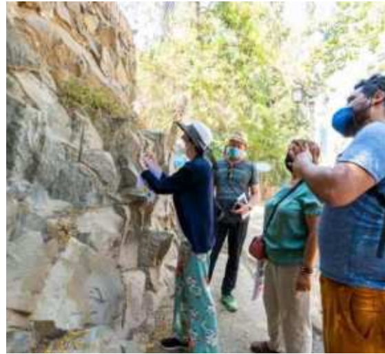
Aprendamos Geología en el cerro Santa Lucía, Santiago