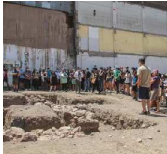
Santiago arqueológico, Santiago