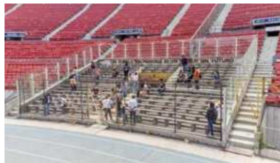
Estadio Nacional Memoria Nacional, Ñuñoa