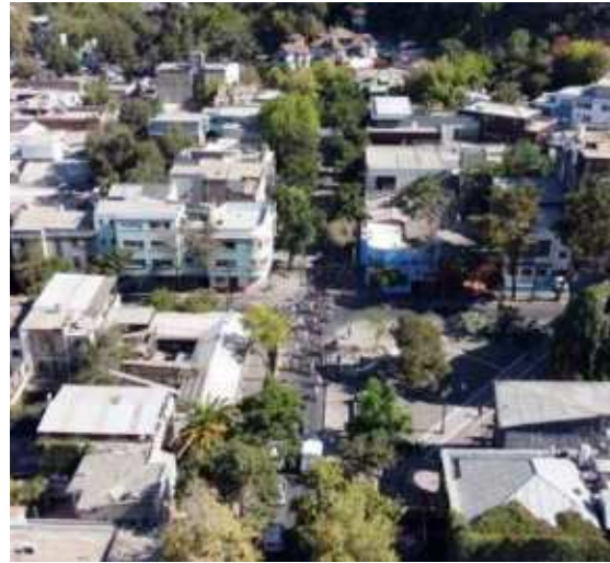
Ciclovía de la Chimba: una ruta cuidadora; Santiago, Recoleta, Independencia y Renca