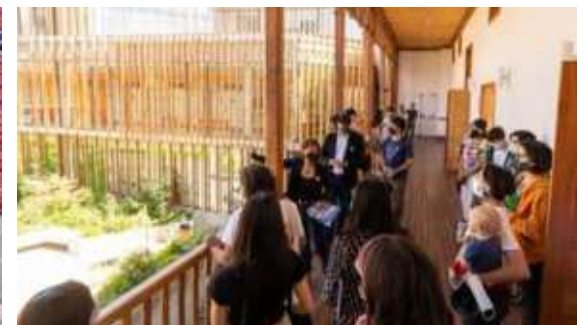
Centro Comunitario + CESFAM Matta Sur, Santiago