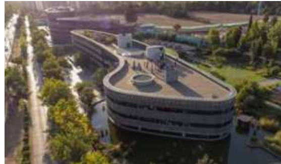
Edificio Tánica y Edificio B, Vitacura

Algunos sitios que participaron en la quinta versión (2022):