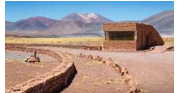
Plan maestro y diseño de infraestructura turística cultural en Socaire, región de Antofagasta