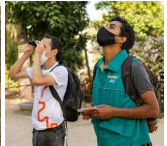
Avistamiento de aves el Parque Bicentenario de la Infancia, Parque Metropolitano, Recoleta