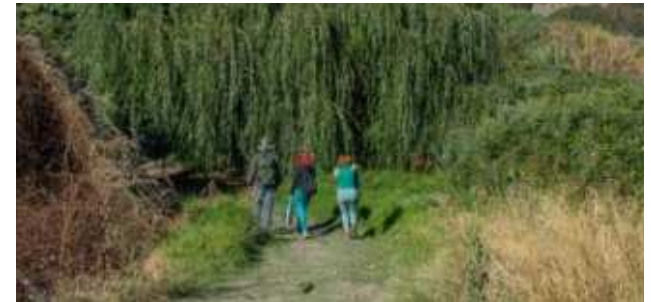
3. Memorias de las aguas Biorutas Mapocho, varias comunas