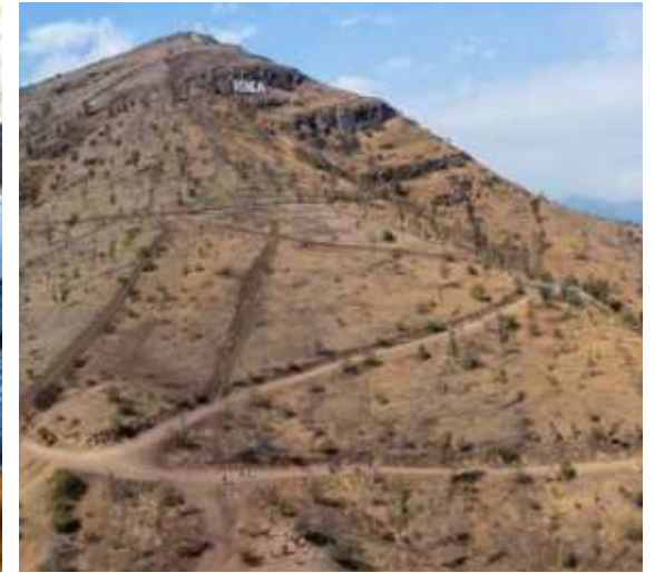
Cerro Renca, Renca