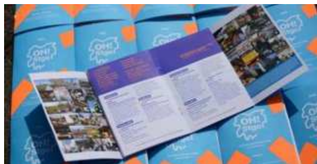
Papelería física; guías, afiches, poleras etc.