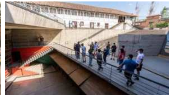
Campus Lo Contador (Casa Lo Contador Monumento Nacional y edificios anexos), Providencia