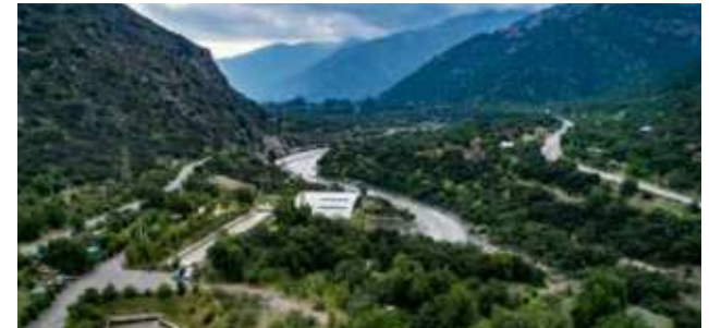
6. Hábitat rural Central Hidroeléctrica Guayacán, San José de Maipo