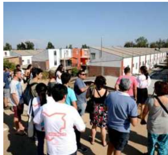
Villa Antumalal, Renca