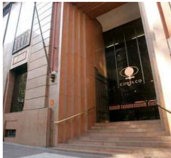
Edificio Corporativo de Codelco, Santiago