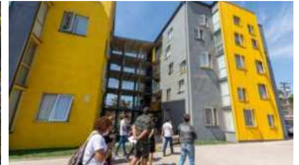
Conjunto Habitacional Justicia Social 1, Recoleta