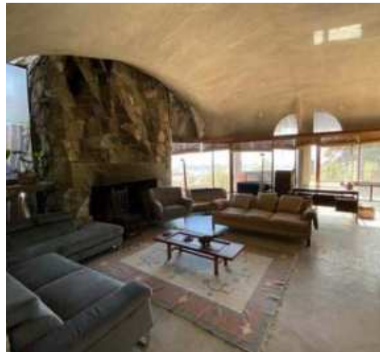
Casa Peña, Colina