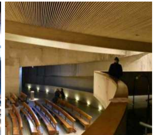
Capilla de Espíritu Santo, Puente Alto