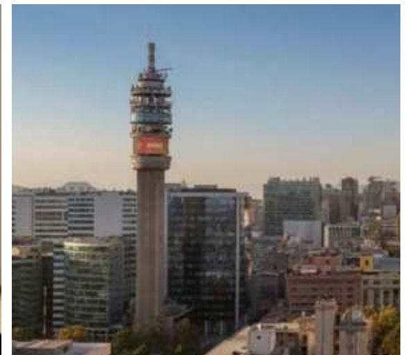
Torre Entel, Santiago