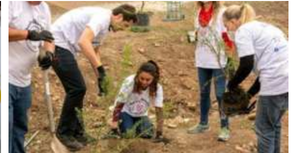
Diseño y construcción participativa Parque Memoria de la Vertiente, La Pincoya, Huechuraba