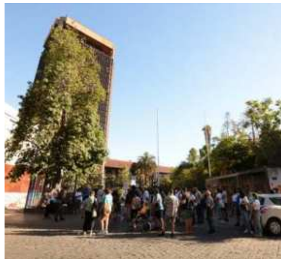
Torre Villavicencio, Santiago