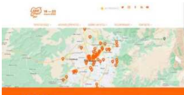
Sitio web del festival - www.ohstgo.cl