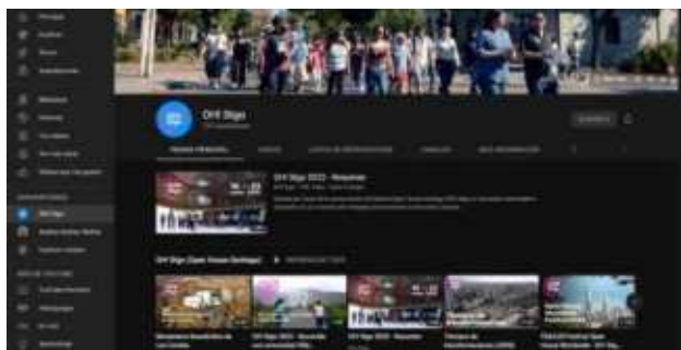
Canal del youtube del festival