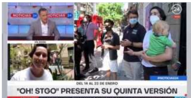
Notas y puntos de prensa en televisión abierta