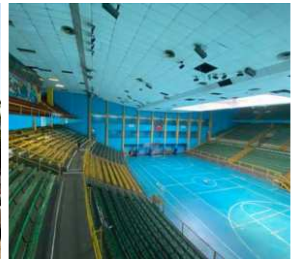
Estadio Victor Jara, Santiago