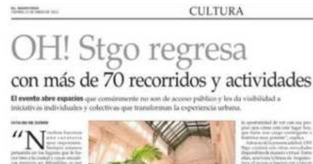
Notas en diarios nacionales