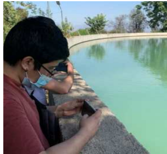
Sistema hídrico de riego - Parque Metropolitano, Providencia