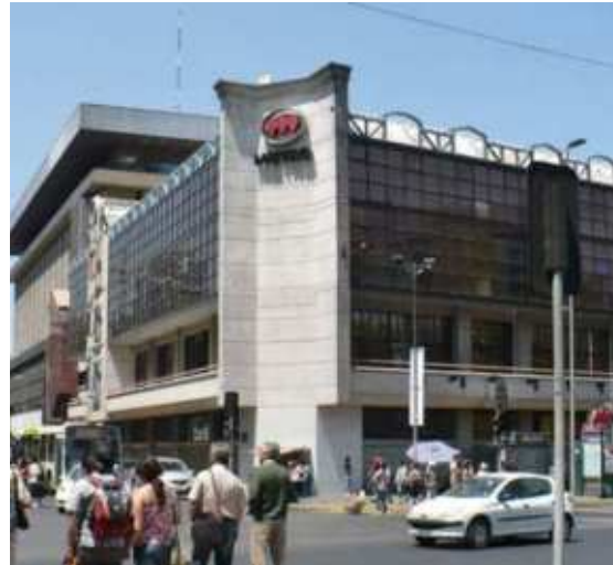
Edificio Corporativo del Metro de Santiago, Santiago