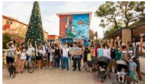
Museo a cielo abierto de San Miguel, San Miguel