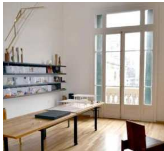
Portal Fernandez Concha, Estudio 221 y Estudio 218