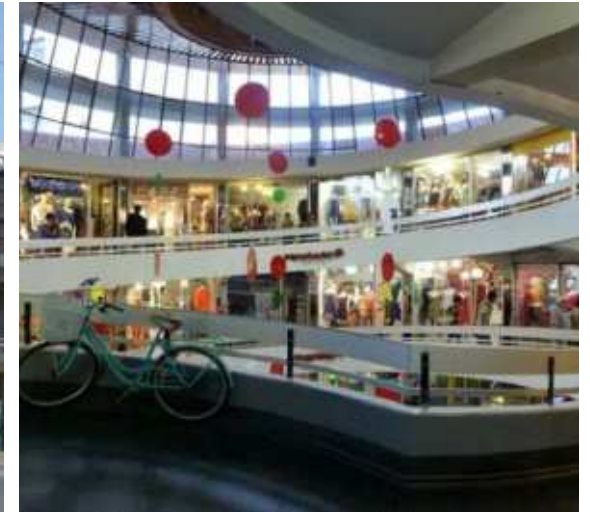
Centro Comercial Dos Caracoles, Providencia