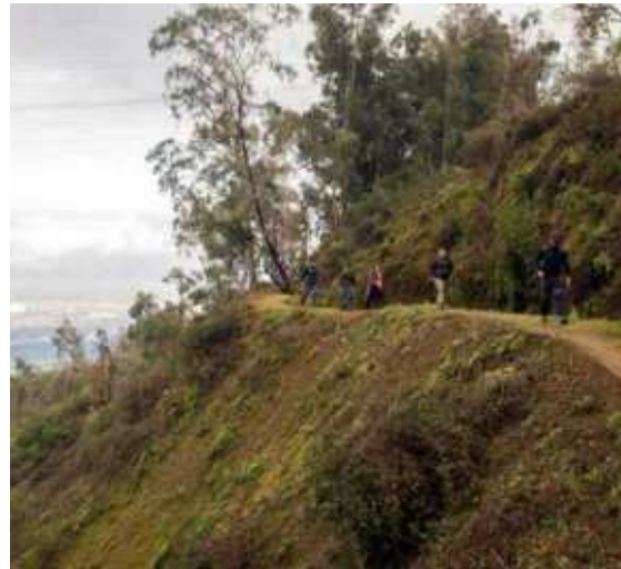
Ruta sustentable de Bosque Santiago, Parque Metropolitano, Huechuraba