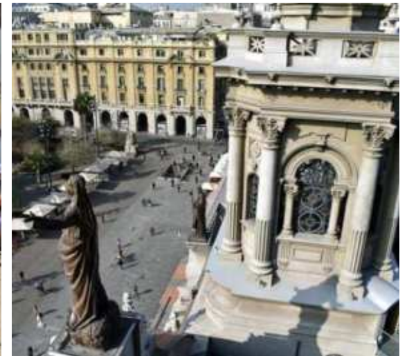
Torres de la Catedral Metropolitana de Santiago, Santiago