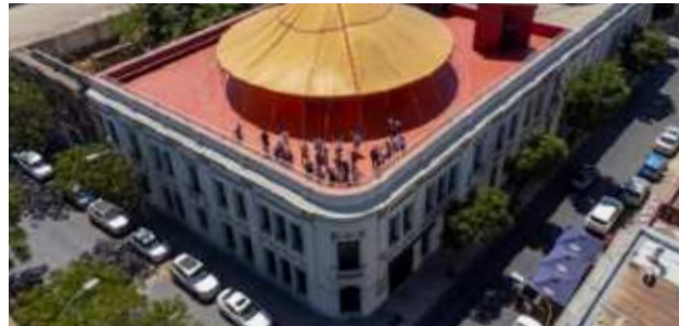
5. Arquitectura contemporánea Centro de Creación y Residencia NAVE, Santiago