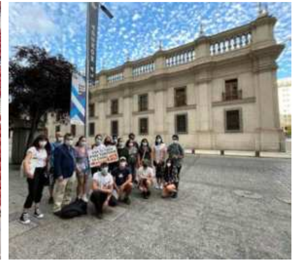
Caminar para Constituir (Palacio de la Moneda, Tribunal Consitiucional, etc.), Santiago