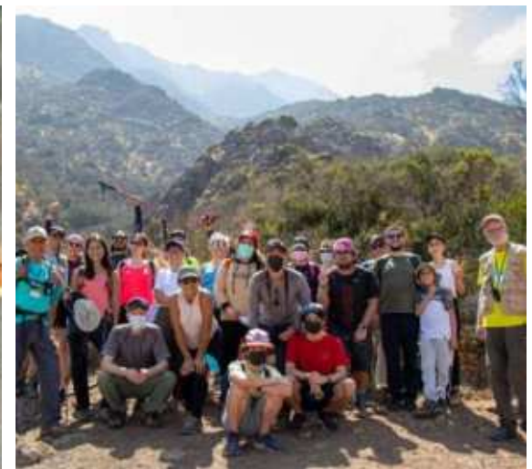
Parque Cantalao, Peñalolén