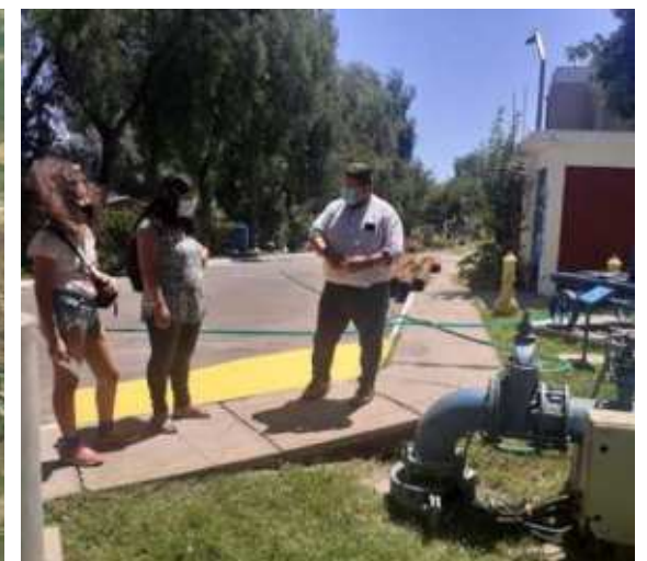
Museo del Agua, Maipú