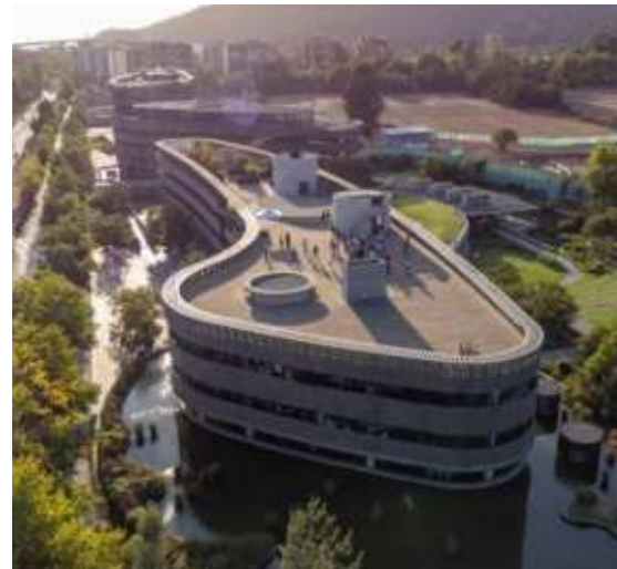
Edificio Tánica, Vitacura