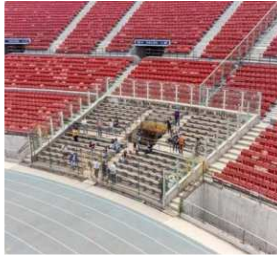
Corporación Estadio Nacional Memoria Nacional Ex Prisioneros Políticos, Ñuñoa