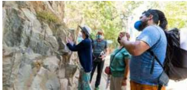
2. Biodiversidad y paisaje Aprendamos Geología en el Cerro Santa Lucía, Santiago