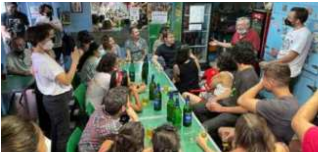
7. Espacios de ocio y encuentro Los bares son patrimonio, Santiago