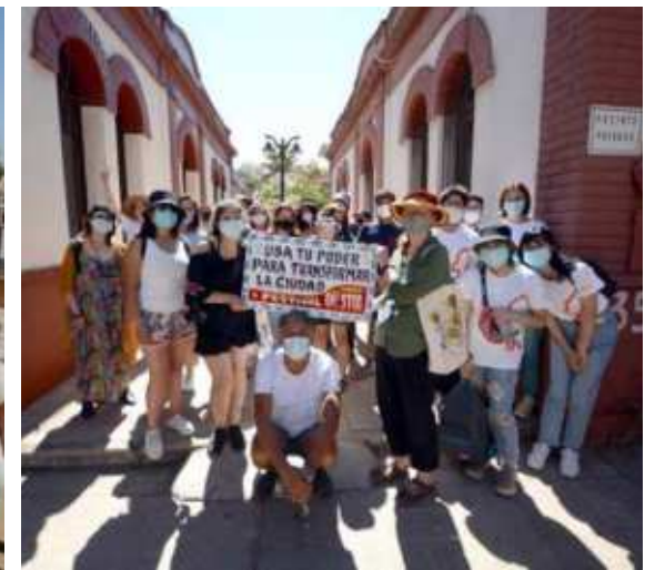
Comunidad Barrio Bellavista, Providencia