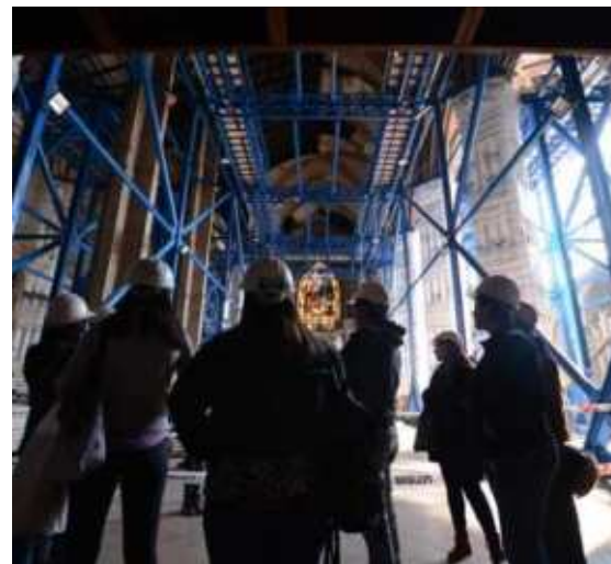
Basílica del Salvador, Santiago