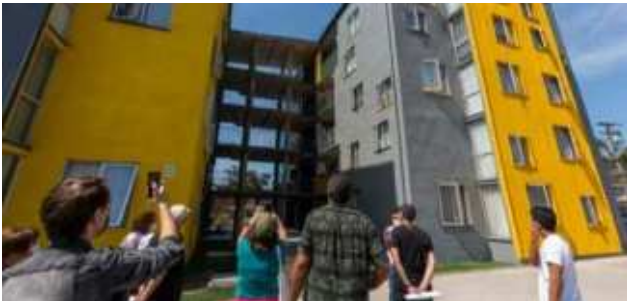
4. Barrios y transformación social Conjunto Habitacional Justicia Social 1, Recoleta