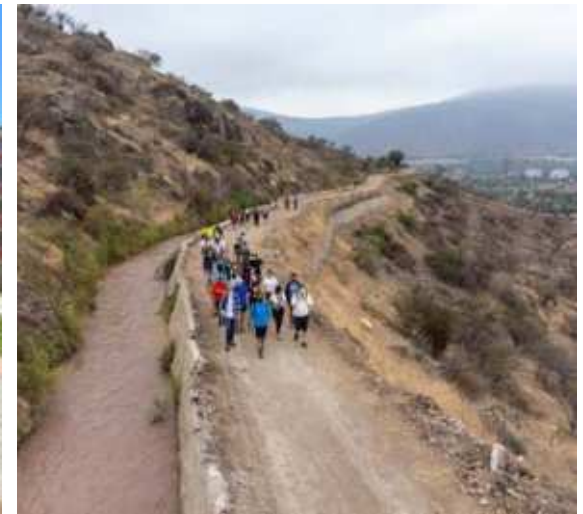
Canal El Carmen, Huechuraba