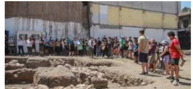
9. Centro histórico Santiago arqueológico, Santiago