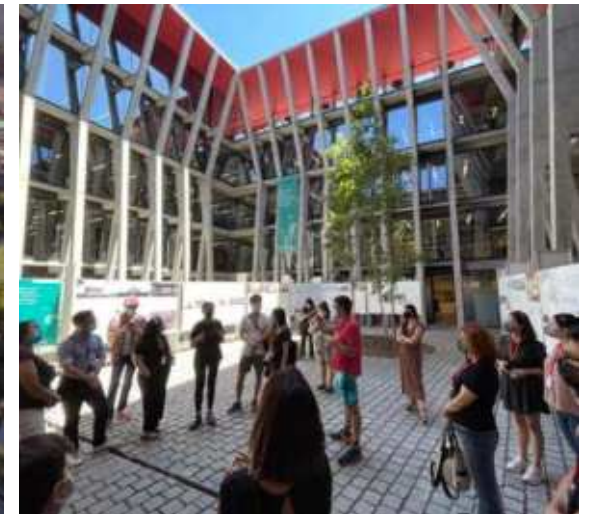
Palacio Pereira, Santiago