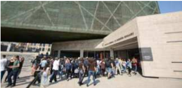
1. Derechos humanos a 50 años del golpe de Estado Museo de la Memoria y los Derechos Humanos, Santiago