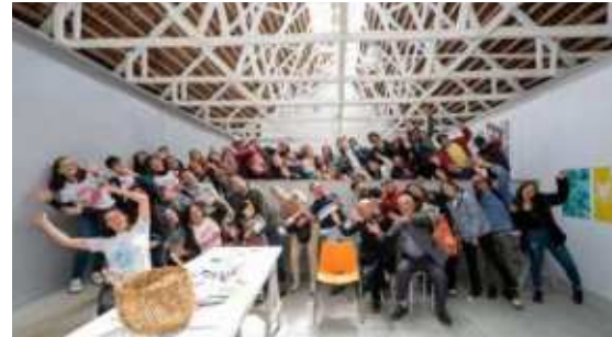
Festival Castro Abierto, Chiloé, región de Los Lagos

Nuestras líneas de trabajo apuntan al diseño y construcción participativa, aprendizaje ciudadano, e investigación y gestión de proyectos.