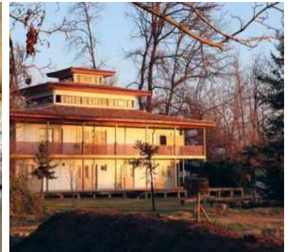
Escuela Agroecológica de Pirque, Pirque