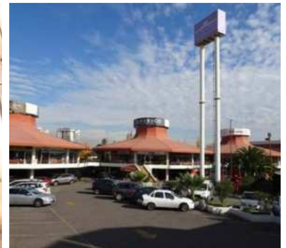
Los Cobres de Vitacura, Vitacura