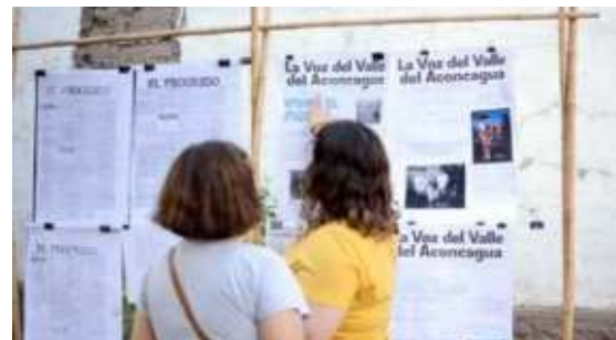
Relacionamiento comunitario en torno de la fiesta religiosa de Curimón, región de Valparaíso