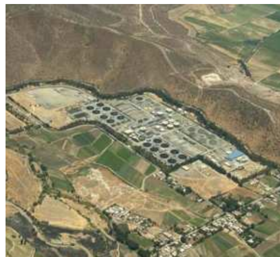
Planta de Tratamiento de Aguas Servidas La Farfana, Maipú