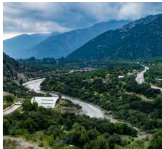
Central Hidroeléctrica Guayacán, San José de Maipo