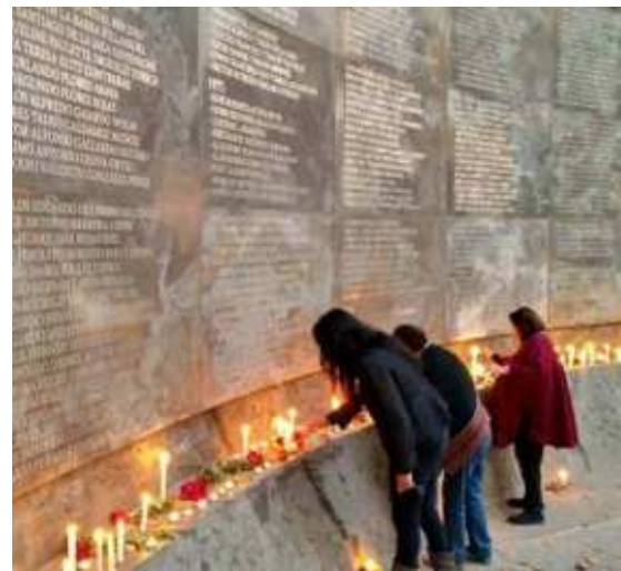
Villa Grimaldi, Peñalolén