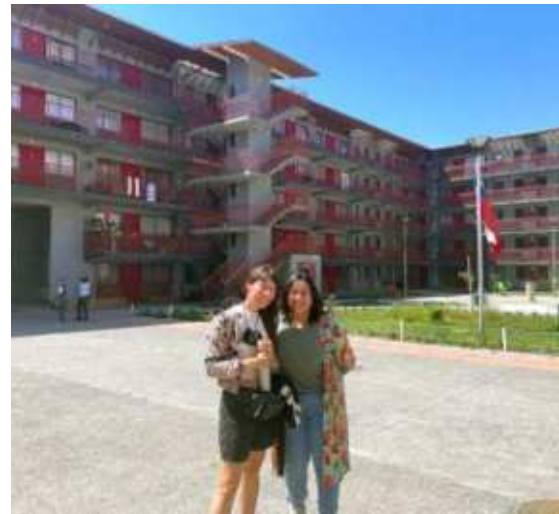
Conjunto Habitacional Comunidad Ukamau, Estación Central